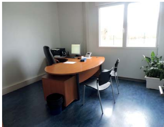
Bureau de consultation

Les locaux contribuent à créer un environnement propice à la qualité des soins.