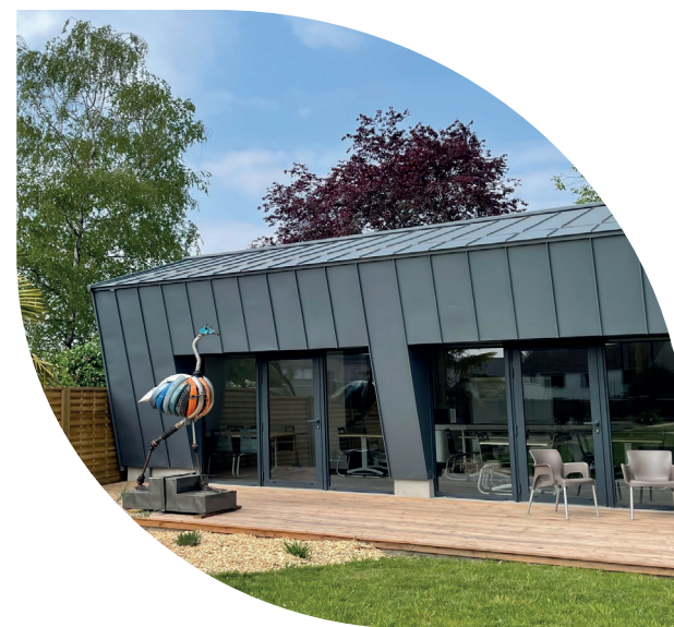
Photo de couverture : Cour du PRISM 45, Avril 2023

Une offre de soins de l'hôpital public Un dispositif global, innovant et diversifié