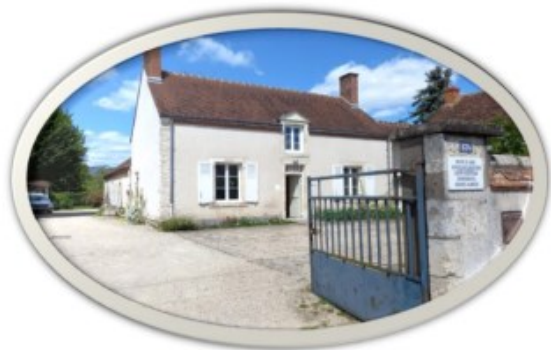
Centre de Soins Psychiatrie de la personne âgée - Olivet

Infirmières Aide-soignante Aide médicopsychologique Psychologue Neuropsychologue Assistantes sociales Agents des services hospitaliers.