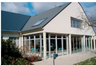
Centre de soins psychiatrie de la personne âgée – St Denis de l'Hôtel